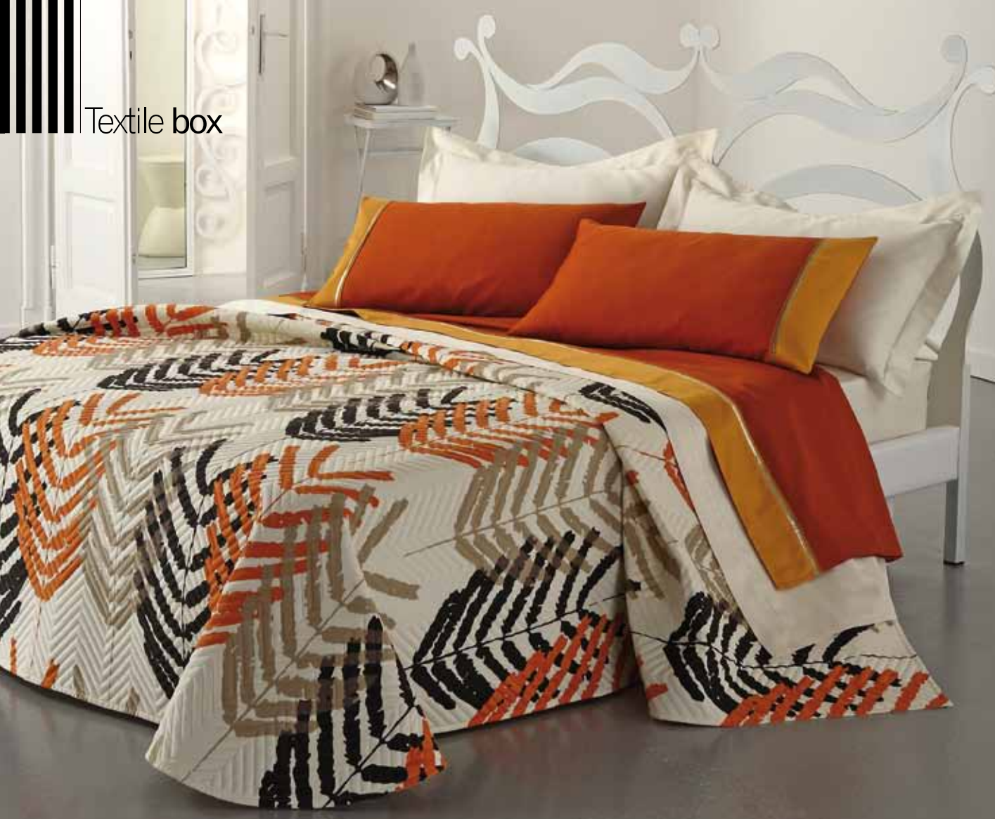
Via Roma, 60 - Copriletto trapuntato Positano