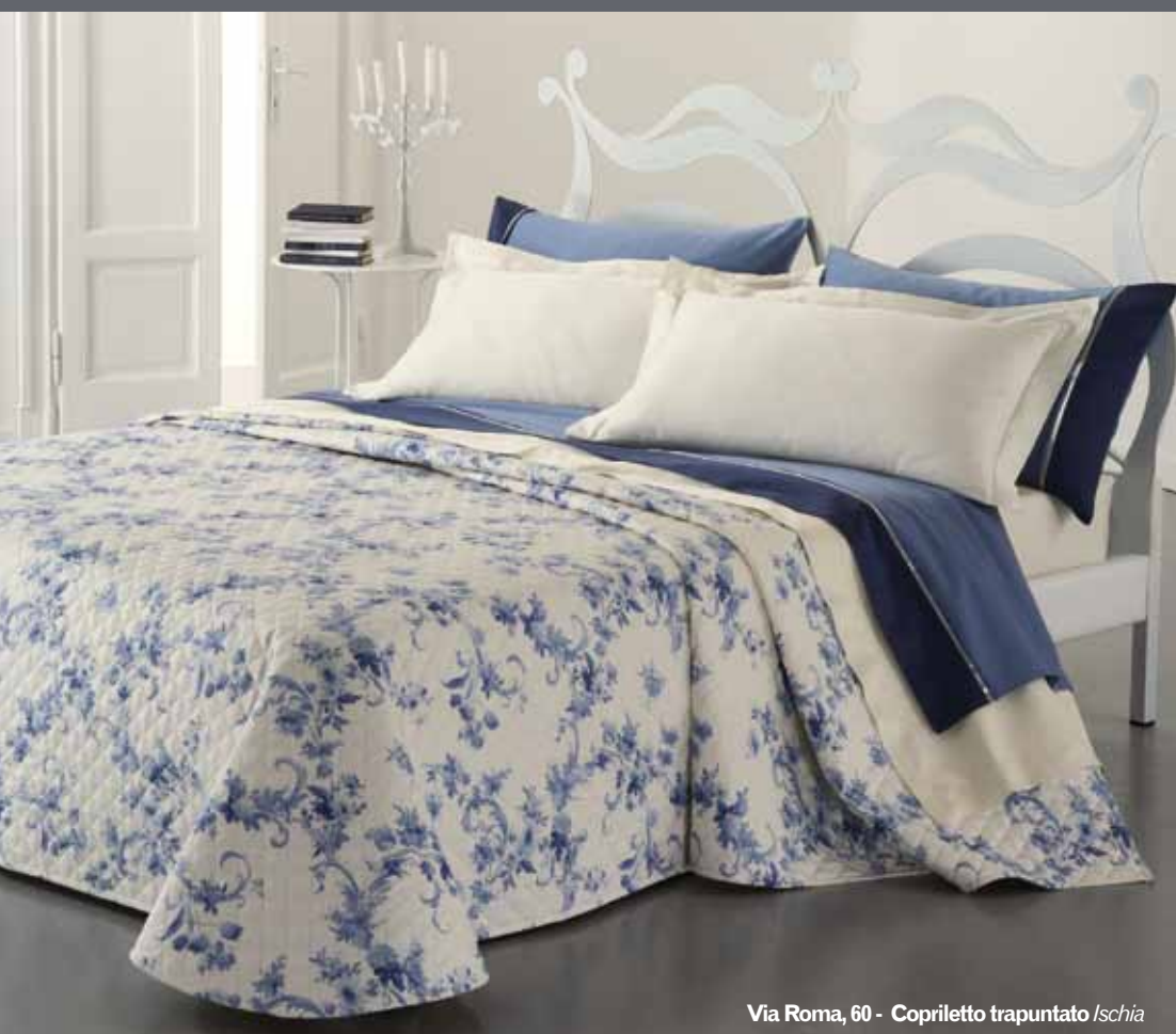
Via Roma, 60 - Copriletto trapuntato Ischia

Il quilt Positano , come Capri , presenta anch'esso una copertura caratterizzata da brillantissime stampe su tessuto in cotone misto viscosa. Per Ischia , invece, la trapuntatura è a rombetti e le stampe su purissimo tessuto in cotone misto lino.