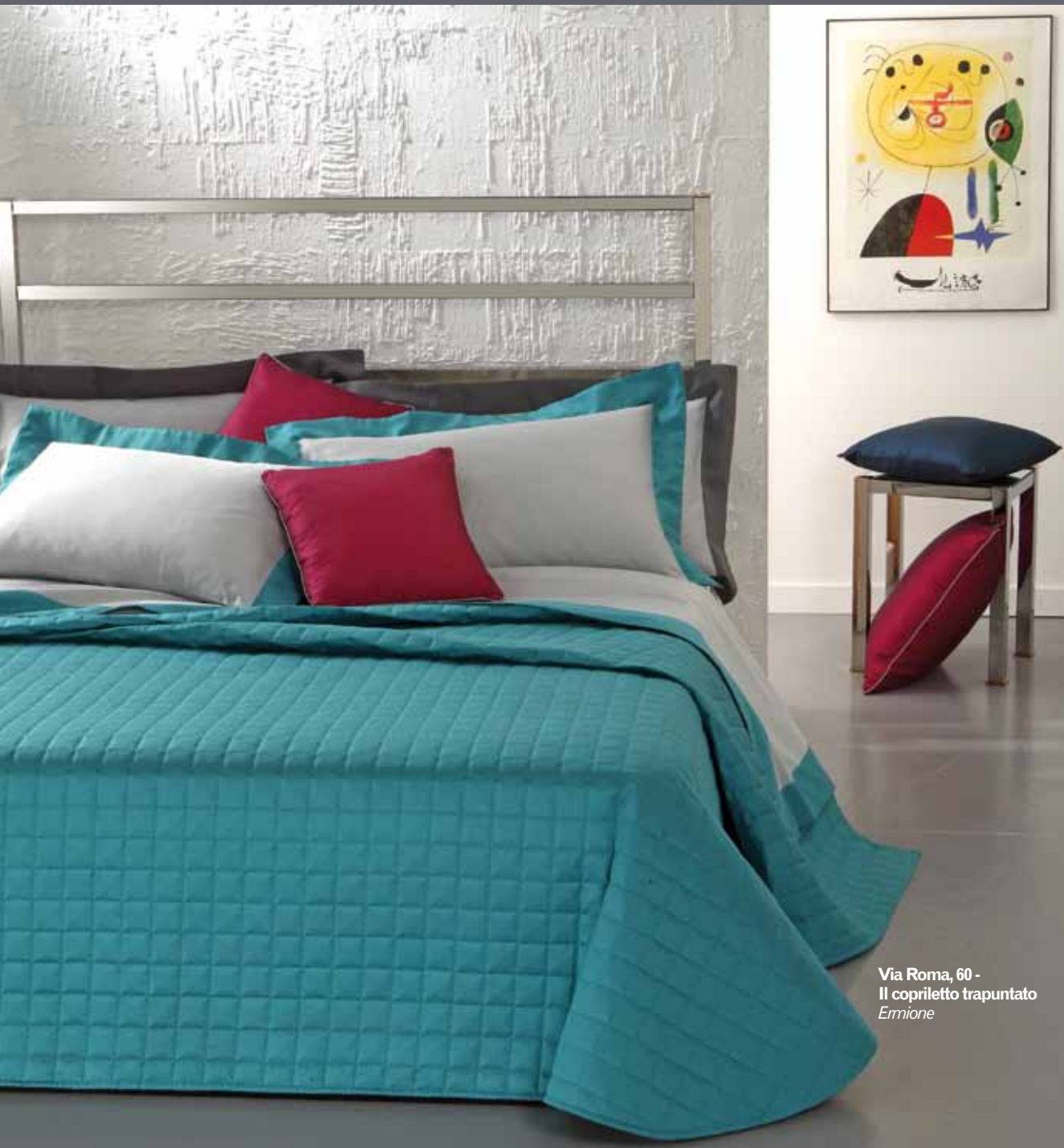
Via Roma, 60 - Il copriletto trapuntato Ermione

Sempre eleganti e raffinate le linee firmate Via Roma, 60 per la Spring/Summer 2011. Una home collection di tendenza ideale per chi ama vivere la propria casa con stile e ricercatezza.